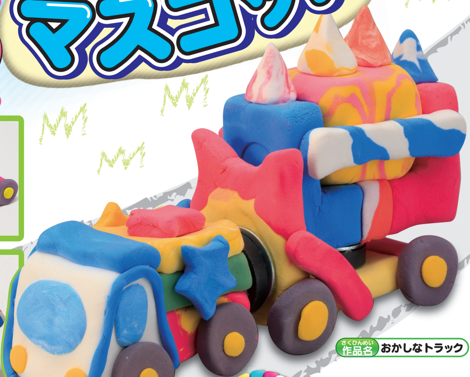
作品名 おかしなトラック