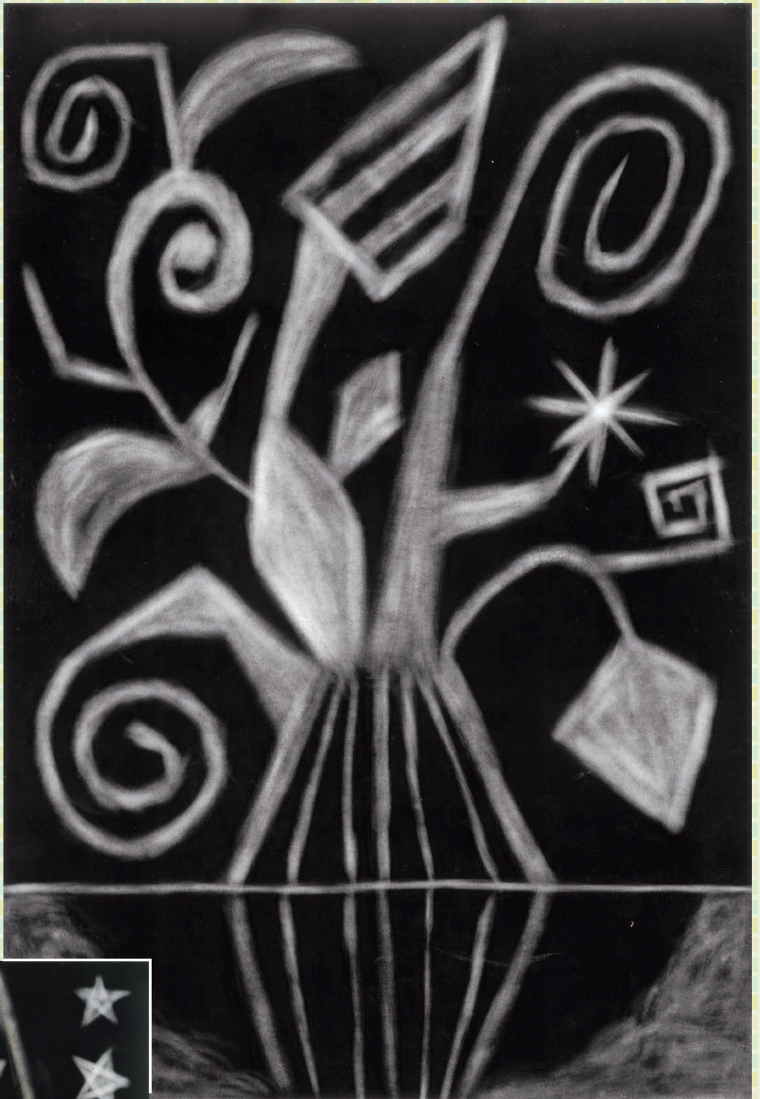
作品名 ミラクルな木